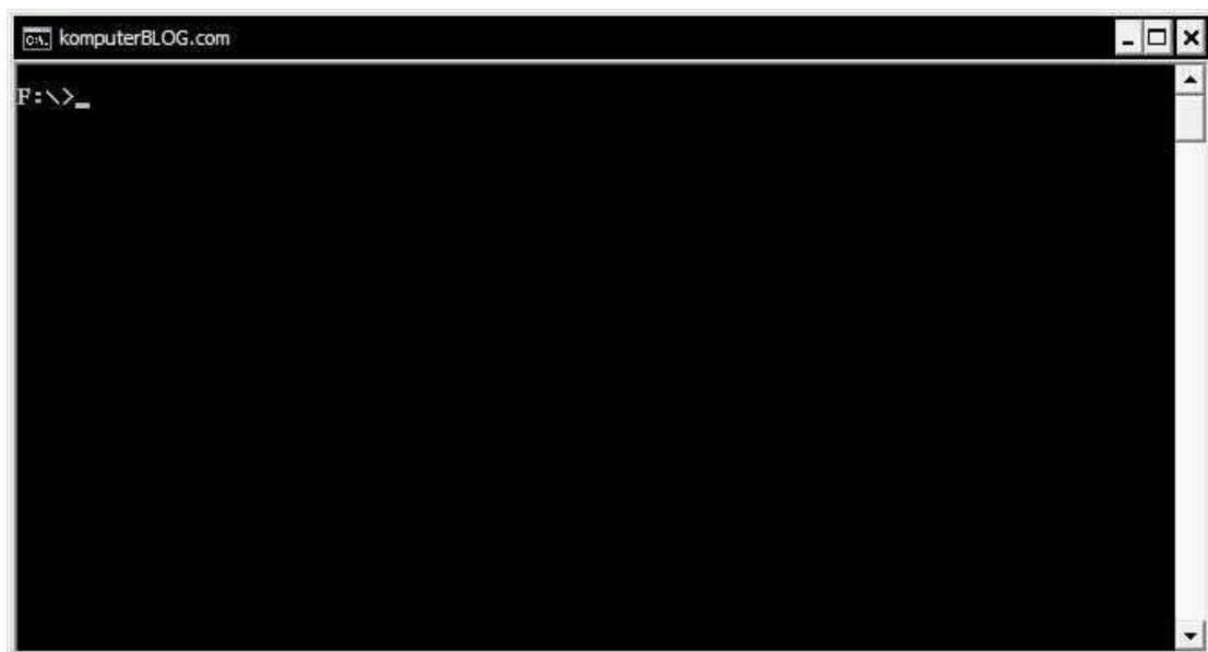
Gambar 2 : Tampilan command prompt